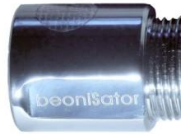
Für Spül- u. Waschmaschinen